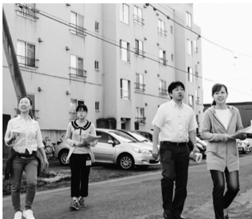
案内チラシを配布する職員

4、困難事例に寄り添うための学習と、いのちと暮らし、憲法を守り活かす運動に参加しましょう。これらの取り組みを職員、友の会が共同して進める事を全体確認して閉会しました。