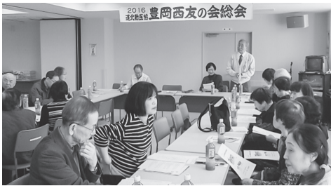
熱心な討議を行う参加者の皆さん

新旭川 友の会 3/13 創立から8年が過ぎた新旭川友の会。今回、23人の参加で行われた総会では、日本共産党真嶋隆英旭川市議の挨拶の後、昨年度活動報告