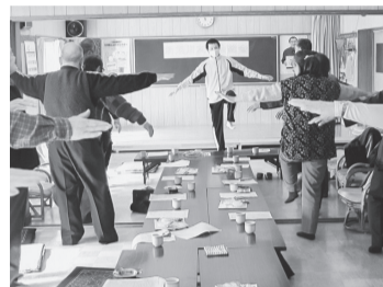
健康体操で認知症予防

新旭川 友の会 3/13 創立から8年が過ぎた新旭川友の会。今回、23人の参加で行われた総会では、日本共産党真嶋隆英旭川市議の挨拶の後、昨年度活動報告