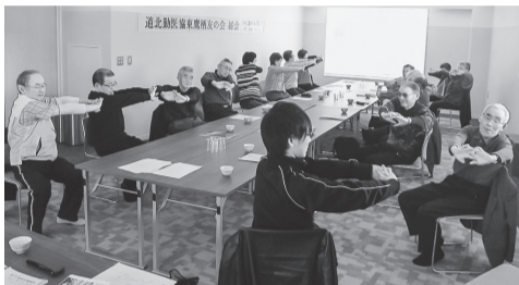
全員で座りながらのエクササイズ

鷹栖 友の会 3/13 鷹栖友の会総会は11人が参加。決算報告と道北の医療配布名簿確認を行い、戦争法廃止署名も連