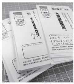
届いた署名ハガキ

この2000万人署名を必ず成功させ、私たちの声を国会に届け、戦争法を廃止にさせるためには、ご自身で署名をお願いします。署名を呼ぶことはもちろん、署名を呼ぶことが重要です。5月3日が集約です。ぜひご協力をお願いいたします。