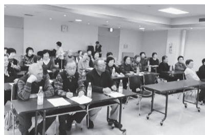
多くの皆さんが戦争法を学んだ

和寒町民センターにて、和寒友の会交流会が行われ、31人が参加しました。今回、参加者全員で戦争法のDVDを視聴。知識を深めた上で、2000万人署名を進める意思統一を行いました。