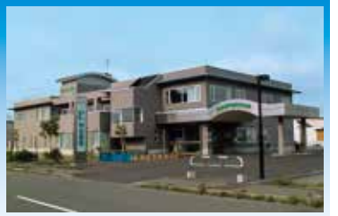
道北勤医協宗谷医院