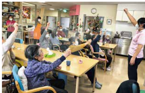
今年もガンバリましょう!宗谷医院デイサービスのみなさん

い街で、市民ぐるみですすめる「医療と健康のまちづくり」運動にも取り組めるようになりました。 地域医療を担う医師・医療従事者を育てる取り組みを住民ぐるみ・自治体ぐるみに発展できれば、未来は暗くありません。