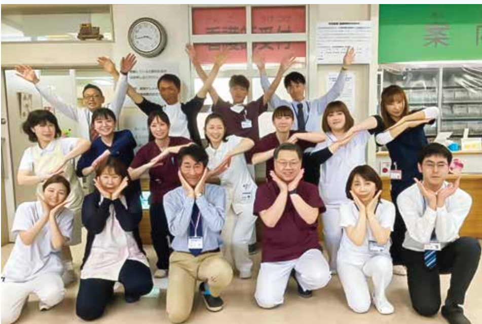
若さとチームワークで宗谷の地域包括ケアを担う宗谷医院職員