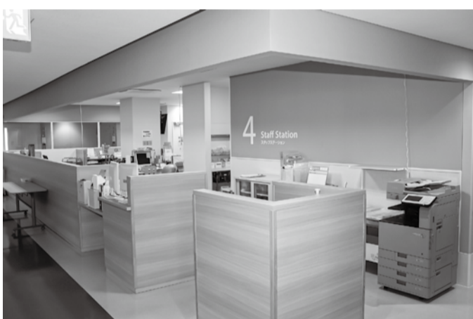
地域包括ケア病棟再開の準備が進む4病棟

道内には緩和ケアをもつ病院は25施設ありま。しかし、緩和ケア病棟は札幌圏と道南に偏在しており、旭川市には旭川厚生病院を含め2病院があるのみです。コロナ禍で緩和ケアのニーズは高く、各方面から問い合わせが続いています。