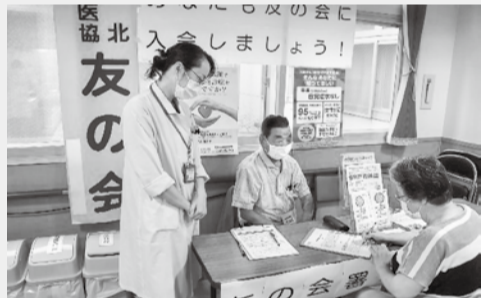
クリニックでの署名風景

保険証残して! 便利か不便かは保険料を納めている人それぞれに違うと思います。現行の保険証を残してください!!!