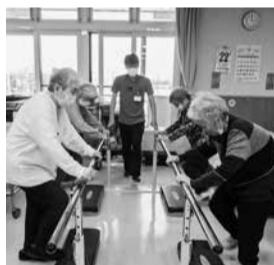
旭川きた介護センター

●ながやま医院 デイサービスセンター 広くゆったりとした空間で理学療法士による身体・動作評価。看護師による身体観察と皮膚状況