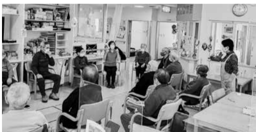
アットホームなデイサービス

送迎、入浴、手作りの昼食、創作活動、多彩なレクリエーションなど利用者のみなさまが楽しく元気な時間を過ごせるよう、スタッフ全員で対応させていただきます。アットホームな雰囲気でお迎えます。