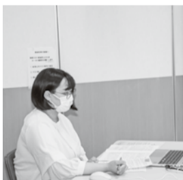
演題発表する参加者