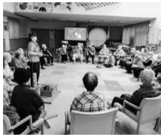
ながやま医院デイサービスセンター