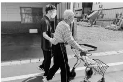
訪問リハビリの様子

に応じた看護を行います。訪問する看護師はあなたやご家族に寄り添うことをめざし、住み慣れた場所での療養、お看取りの支援ができます。つらい時、困った時、どうぞあなたの声を聞かせてください。