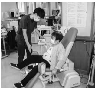
筋力トレーニングマシン

昼間だけ施設で、医療、看護、食事、入浴、リハビリなどのサービスをご利用いただけます。 ●入所 症状が安定していて、毎日の生活に介護を要する方に入所していただき、食事・入浴・排泄の介助はもとより、リハビリ、レクリエーションなども含めた総合的な生活支援を行って、家庭生活への復帰を目指します。