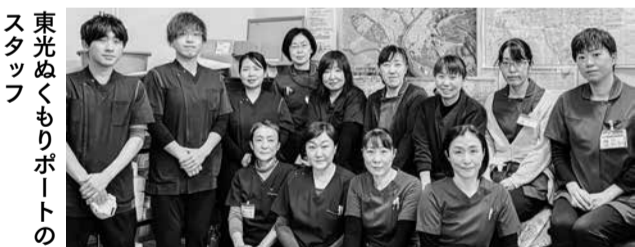
東光ぬくもりポートのスタッフ