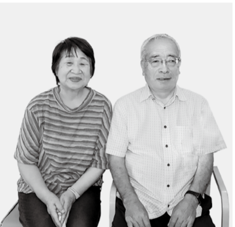
ご主人と二人でお話してくれました

若い人たちにも友の会活動を知らせ、入ってもらいたい. Text describing the home delivery service and the association's goal to reach younger people.