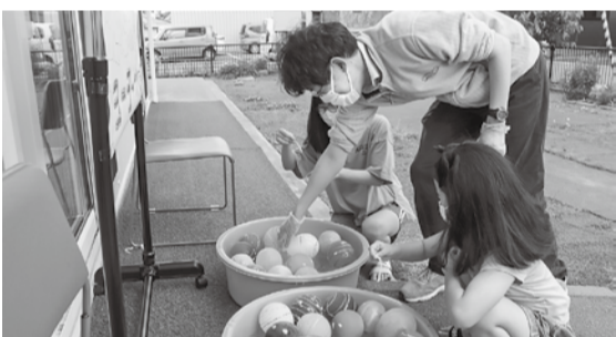
ヨーヨー釣りに子どもたちも大喜び

6月25日に「ただいま食堂」が開催された22世帯、80人の親子が参加しました。今回のメニューはオムライス、バナナシエイク、サクランボ、お菓子の詰め合わせ、ヨーヨー釣りなど多彩な内容を準備してコロナ禍でがんばる親子を応援しました。今回参加した子どもたちはヨーヨー釣り体験も行いました。ヨー