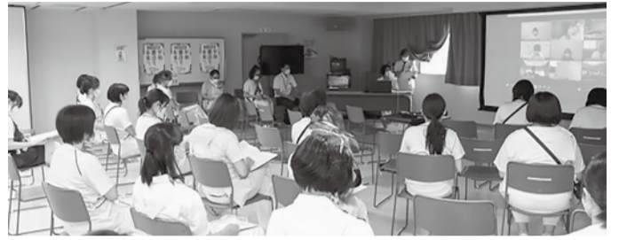
オンラインで開催された道北勤医協全看護師集会

6月22日、一条クリニックをメイン会場にオンラインで開催された「道北勤医協全看護師集会」は9会場、75人が参加しました。