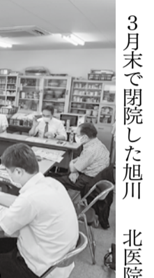
3月末で閉院した旭川 北医院の診療スペースの新たな活用に

旭川 北医院の診療スペースの新たな活用に、6月23日、友の会連合会と病院職員11名で、閉院した勤医協札幌北病院内に隣接する札幌ほづら会館を見学しました。