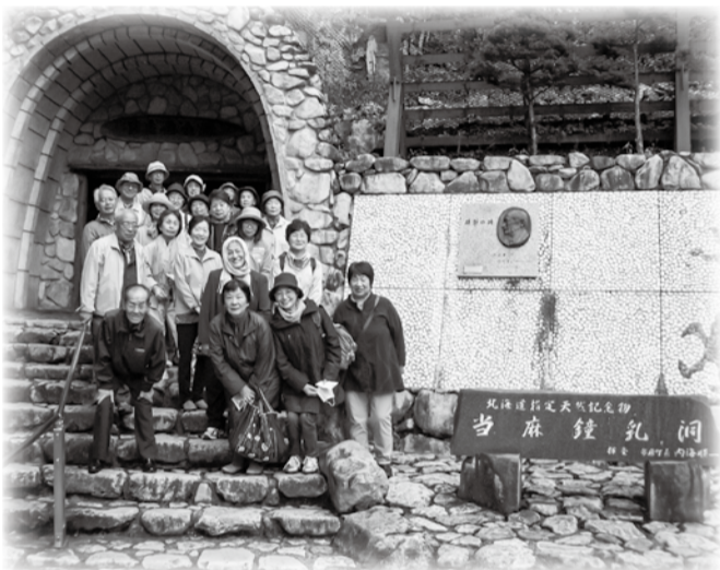
2017年 千代田友の会小旅行より