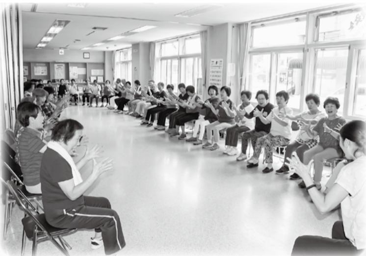
2018年 東光友の会エクササイズの様子