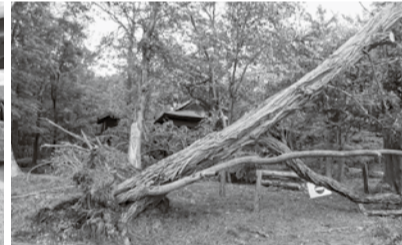
根元から折れた大木

「均等割」とは、世帯あたりの国保加入者の人数に応じて均等に負担する金額を指します。家庭の所得の多少に関わらず、均等に負担しなくてはなりません。ただし、均等割りの金額は自治体によって変動します。