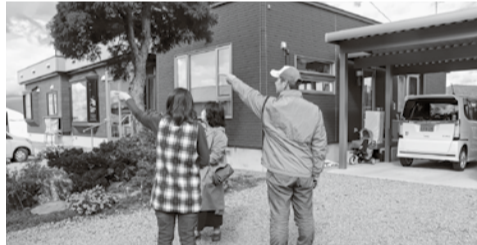
ダウンバーストが通過した進路を指さすAさんご夫婦