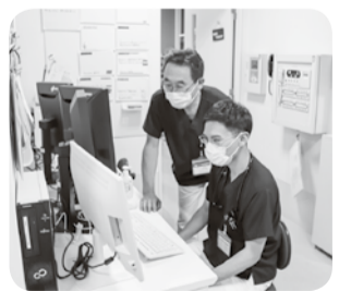
病院での研修風景