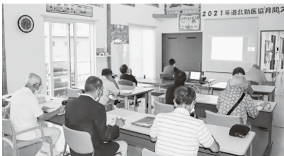
第2会場となったまちづくり交流館

8月30日(月)2021年度の「月間」スタート集会在「一条クリニック」まちづくり交流館「宗谷病院」の3か所とパソコン通信で60名の職員、友の会員が参加して開催しました。