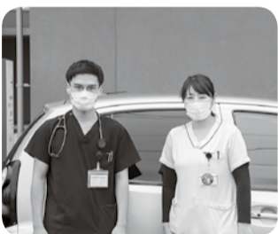
さあ、訪問診療へ出発！