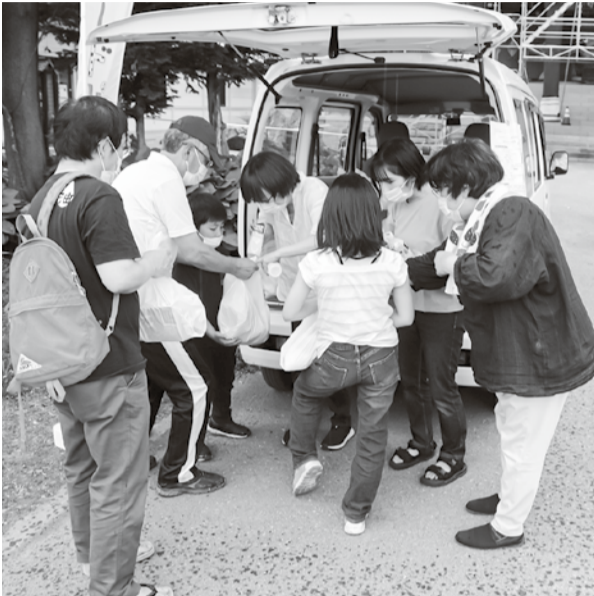
家族連れで参加。カルピスの配布に喜ぶ子どもたち