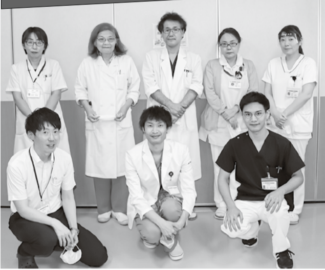
訪問診療に関わる医師、看護師、事務職のみなさん