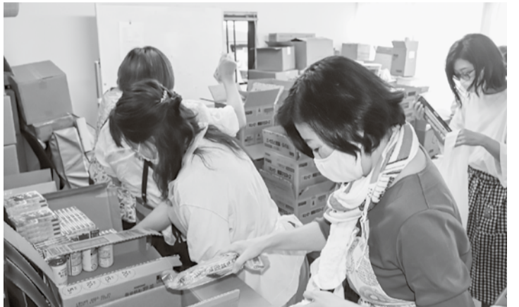
汗だくになりながらの食材袋詰作業風景