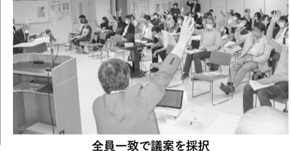
全員一致で議案を採択

2の柱は、地域の人口動向、医療、介護の供給体制の変化、医師をはじめとする職員体制や経営の見通しから、今後すべての診療所がこれまで同様