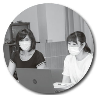
道民医連第10回看護・介護研究交流集会和道北勤医協第34回看護介護研究交流集会(看介研)が7月11日に開催されました。看護介護研究交流集会は日頃、医療・介護の最前線で奮闘する職員たちの実践・交流を目的に毎年、開催されています。

すべての人のいのち・暮らし・人権を守る 「無差別・平等の地域包括ケア」の実践を前進させよう ～コロナ禍の時代を切り開く看護・介護の力～