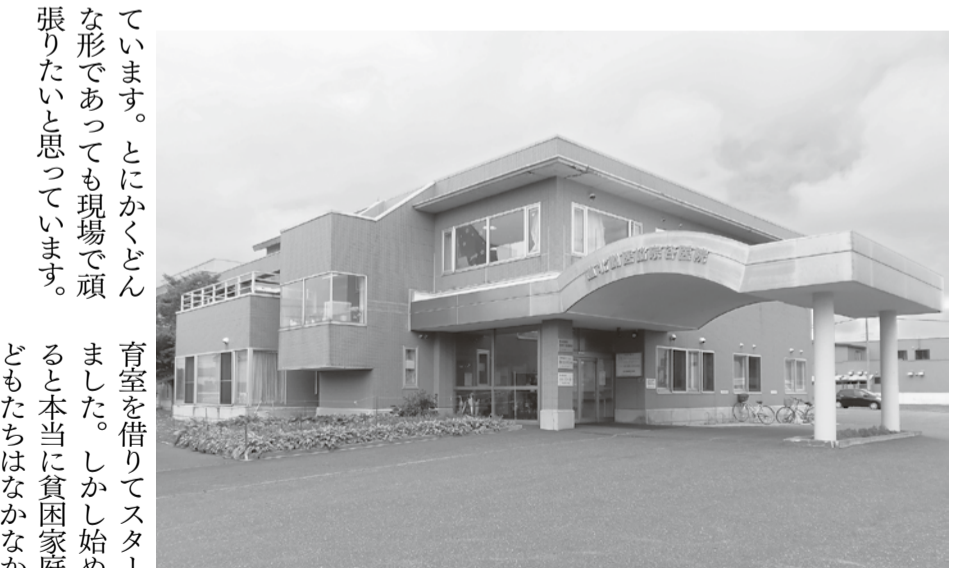
道北勤医協宗谷病院

子ども食堂から見える日本の貧困 千葉県流山市で子ども食堂「おひさま食堂」を始めました。たくさんのごどもたちがやってきます。 立ち上げのきっかけは研修に追われる日々の中で自分自身が地域と関わっていないと感じたことでした。自分に何かできることはないか模索していたとき「こどもの貧困に對し、いまずぐできることをしよう」。全国的にも子ども食堂が目立ち始めました。早速、病院長に相談し、病院の保