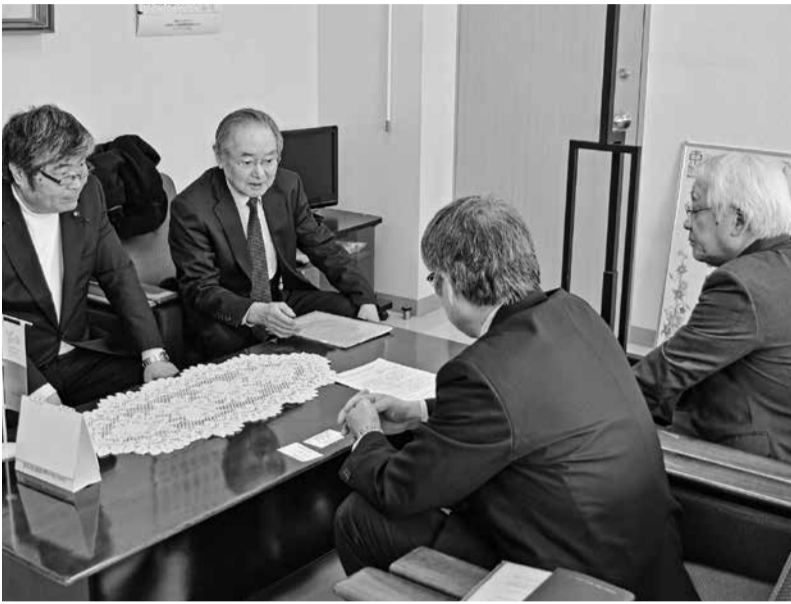
助成拡充を東神楽町に要請する生出町議と上ヶ嶋会長 (写真左から1、2番目)

11年目を迎えた無料低額診療事業。開始から2018年12月末までに364人の方が利用され受診に結びついていました。利用者の方からは「毎月の医療費の負担が多く生活が苦しかった」、「これが必要ならば病院にかかれなかった」、「本当に助