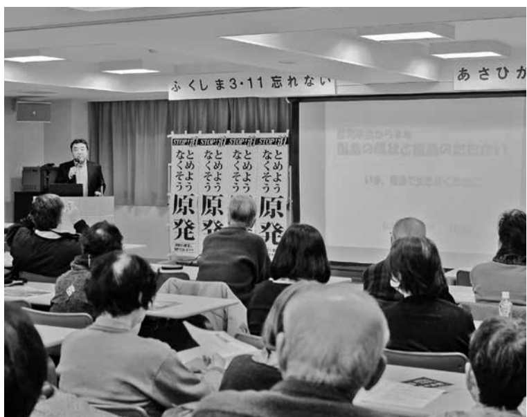
講演する服部さんと聞き入る参加者

さひかわACTTION 2019」を開催。この取り組みは毎年この時期に福島第一原発事故を風化させずに、被災した福