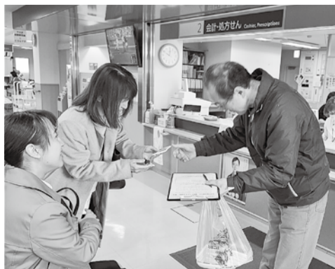
外来待合で署名を集める役員さん

した。友の会ニュースで会員さんに呼びかけたり、院所の風除室、外来待合、スーパードの街かど健康チェック等で役員さんと協力して署名を集めてきました。今後も活動を通じて、憲法を守り平和を守ることを広く訴えていきたい」と、活動の継続に意欲をみせています。