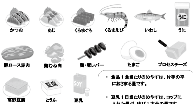
図 アミノ酸の多い食品

・食品1食当たりのめやすは、片手の平におさまる量です。 ・豆乳1日当たりのめやすは、コップに入れた量が、ゆび1本分の量です。