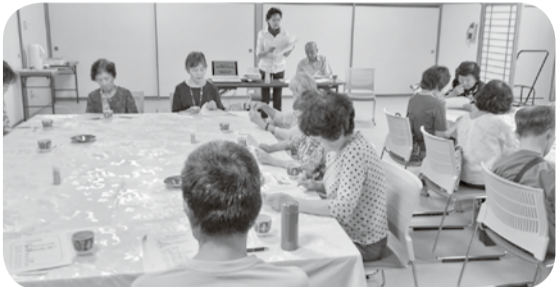
医療講演やふまねっとも(朝日・中央友の会総会)