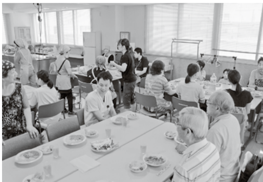
みんな揃って「いただきます！」

今回は、夏休み中の小学生と中学生、家族と一緒に小さなお子さんも参加、子どもたちや家族、ボランティアさん合わせて30人が集まりました。メニューは暑い夏を乗り切るカレーと卵たっぷりマカロニサラダです。子どもたちは楽しく遊び、おいしいカレーライスでおなかいっぱい。「カレーの味に深みを加える方法を教わりました」「2人の孫を連れて参加。遊びとおいしいご飯で大喜びでした」と参加者やボランティア