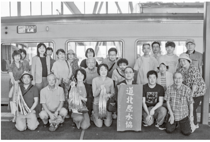
道北代表団の出発式

帯していきましよう。道北勤医協と友の会からの5人の代表は、猛暑の中、全日程に参加し、学習と交流を深めました。