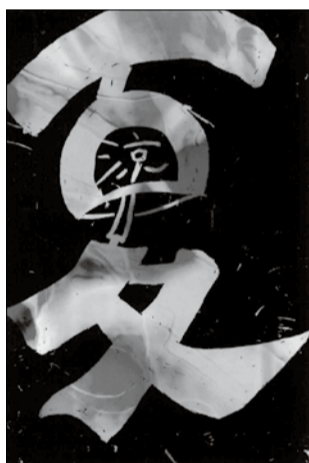
涼・夏 さちさん 旭川市 阿部

北海道高教組の組合運動の中で、「旭川の地に民主的な病院を」と職場の仲間たちと一緒に道北勤医協創設の運動に携わりました。