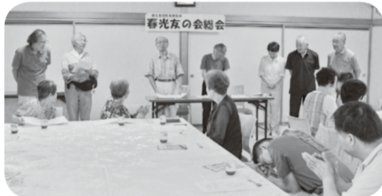
幹事の皆さんがあいさつ(春光友の会総会)