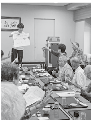
クイズ形式で楽しく学習(和寒友の会)

和寒友の会では7月28日に健康相談会と温泉交流会を遊湯びっぴで開催し、19人が集まりました。はじめに血圧と体脂肪の健康チェックを実施。看護師より「血圧について」