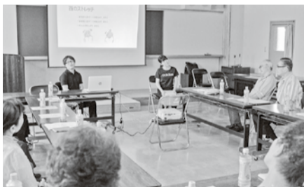
ストレッチしながら頭の体操も(名寄友の会)