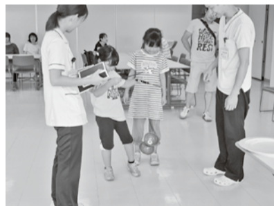
ジャグリングを初体験

安倍政権は最低保障年金を実施するためには財源がないと言っています。が、大企業や富裕層への行き過ぎた減税をやめれば消費税を増税しなくても実現可能です。