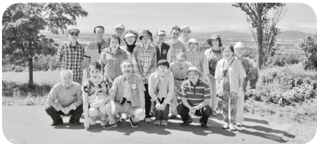
就実の丘で記念撮影(美瑛友の会丘めぐりツアー)