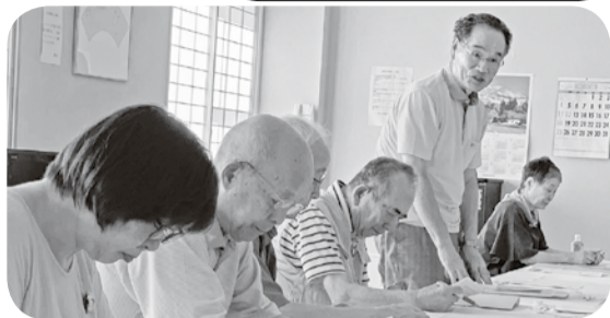
総会議事を熱心に議論(末広友の会総会)