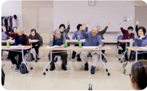
リハビリ技士と笑顔あふれる健康体操