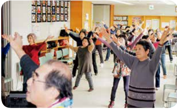
今年3月で10周年。毎月の運動教室