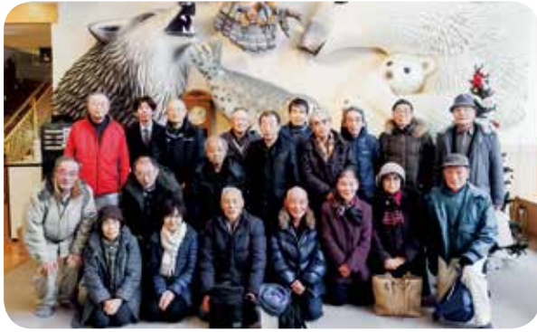
21人が集まり交流。大腸がん検診の意義も学ぶ