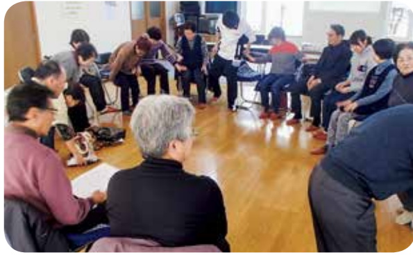
配布世話人さんと輪になり楽しく脳トレ運動