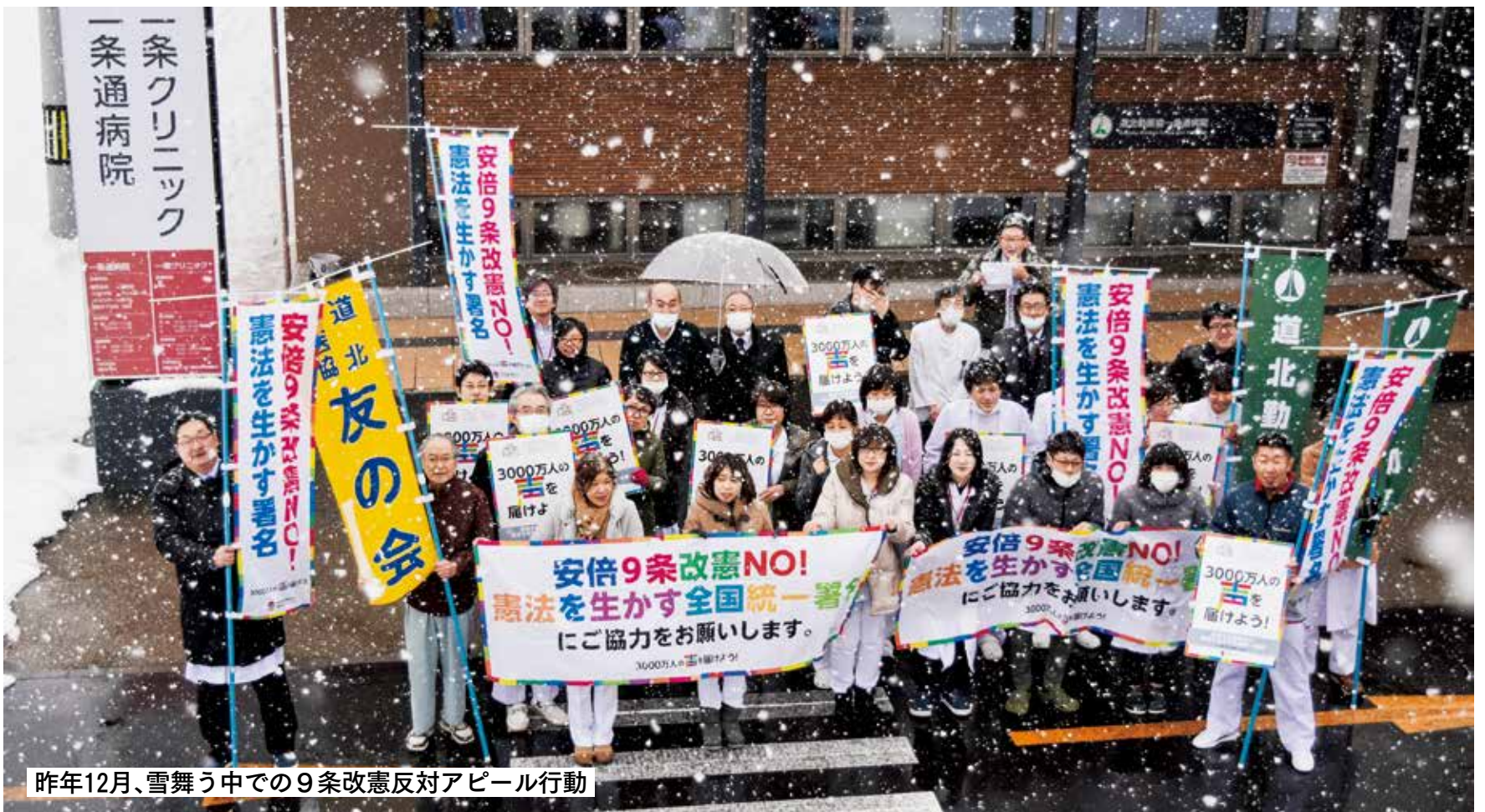
昨年12月、雪舞う中での9条改憲反対アピール行動