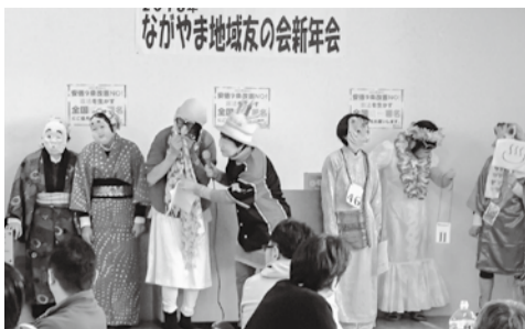
ながやま医院 永山南友の会が 平和盆踊り披露