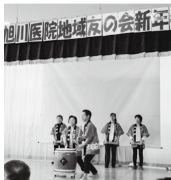
旭川医院 場内に響く迫力の太鼓