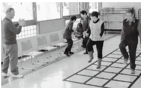
中央長栄会で ふまねっと