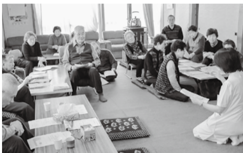
美瑛友の会は二つの取り組み 下宇莫別福寿会で 認知症学習