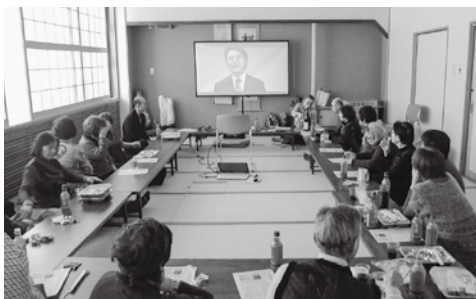
東川友の会 新年会で 憲法DVD視聴