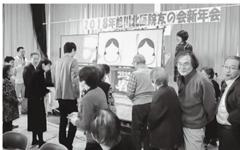
旭川北医院 毎年恒例の 福笑いゲーム