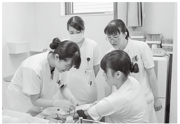
指導者が見守る中、採血を練習する新人看護師

識や技術の習得はもちろん、患者さんやご家族への対応など徐々に経験を積んでいきます。また、友の会行事等にも参加しますので、よろしくお願いたします。