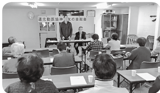
神居友の会 4/14 今年度の楽しい活動を 決めた総会