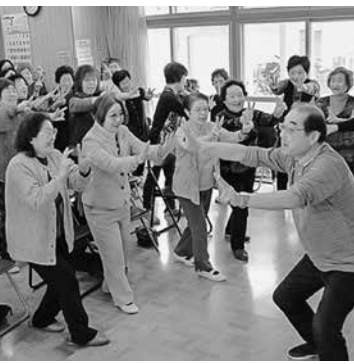
参加者全員でのわらいヨガ

このエクササイズは当時の東光友の会役員会での「会員みんなで体を動かしたい」との声からスタートしました。最初は人が集まるか不安でしたが、ニュースで案内したところ30人が集まりビックリしたそうです。以来、現在に至るまで毎回30人程度が集まり続けられています。