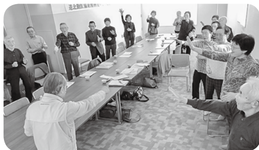
東鷹栖友の会 3/21 総会で 楽しく健康体操