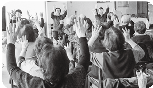
東川友の会 4/14 総会でリハビリ技士と 認知症予防取り組み