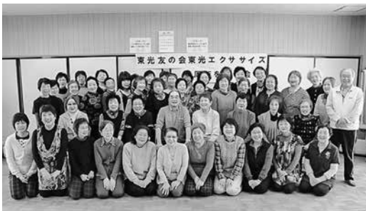
記念祝賀会に出席された皆さん

東光友の会が毎月2回行っている運動の取り組み「東光エクササイズ」がこの3月で活動開始から10年を迎えました。 3月30日には記念祝賀会が開催され、会場いっぱい54人の方が参加しました。