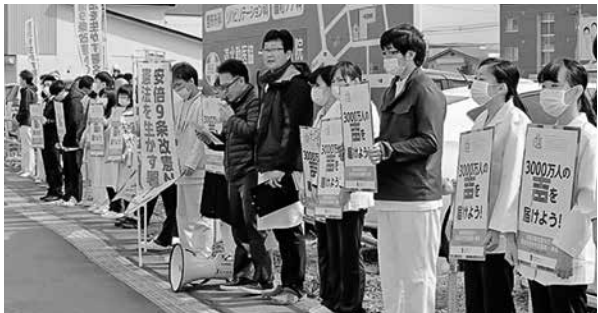
一条通沿いでアピールする職員

4月に入職した新入職員も初めてアピール行動に参加し、民医連運動の第一歩を踏み出しました。