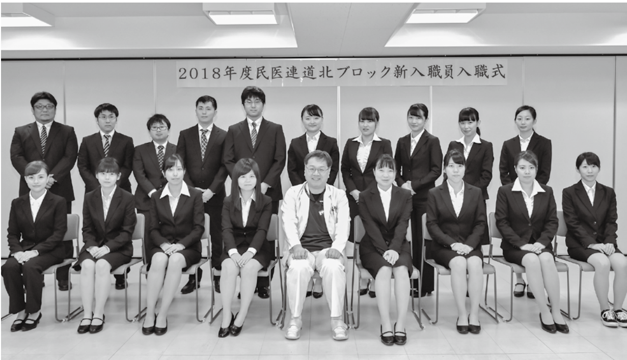
2018年度民医連道北ブロック新入職員入職式