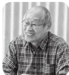
挨拶する晴被会長

6月3日(日)、春光 台友の会が7年ぶりに総 会を開催し、会場の春 光台地区センターには役 員、配布世話人など11人 が集まりました。