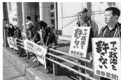
宗谷医院が街頭アピール(稚内市街)

職員も全職員が一人5筆を集めることを目標に掲げ、各職場で憲法学習を深め、地域訪問や街頭宣伝、業者さんへの協力声かけ、毎月9日のアピール行動など署名を広げる活動を進めました。さらに病院、診療所では職員と友の会が協力して、外来待合や風除室で患者さんに署名協力を訴えま