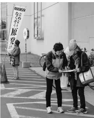
署名する買い物客

6月17日(日)のお昼時、旭川北医院のお花見交流会が行われました。当日は若干肌寒く感じましたが、残春の青空が広がる晴天になり、会場となった旭川北医院の正面玄関前には友の会、職員合わせて60人が集まりました。