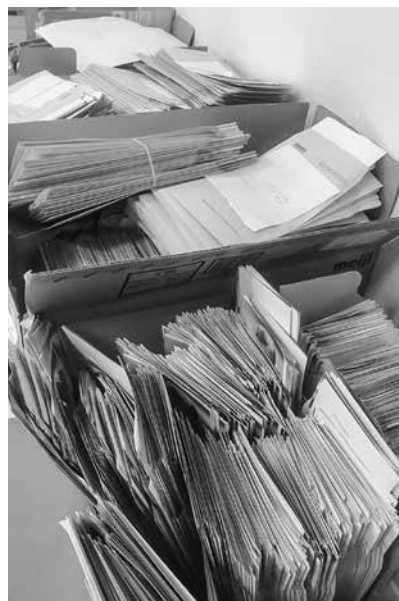
郵送で寄せられた多くの署名

森友加計問題で次々に嘘と隠蔽が露わとなり、足元が揺らぐ安倍政権。しかしその裏で憲法改正に向けての準備は着々と進められています。その動きを許さず、平和憲法9条を守る国民の声を大きな力にするための「安倍9条改憲NO! 全国統一署名」(通称3000万人署名)を広げる運動は、道北勤医協でも職員、友の会が協力してこれま