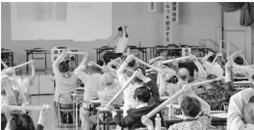
新聞紙を丸めた棒を使った運動