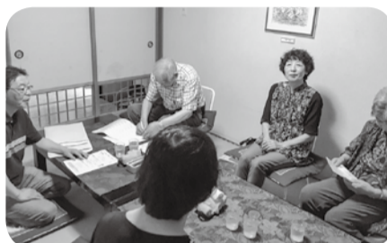
春光台友の会配布人交流会