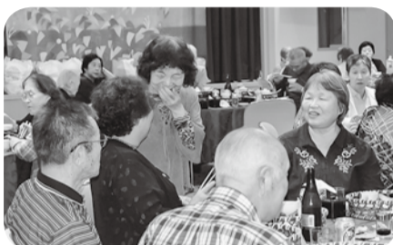
東光友の会バスツアー