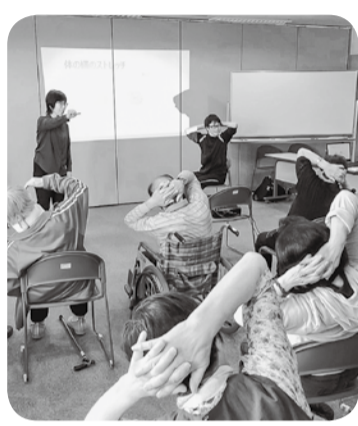
指導を受け体操する参加者

7月8日、聴覚障害の方々が集まった龍耳友の会が12回目となる総会を開催し、14人の会員が参加しました。