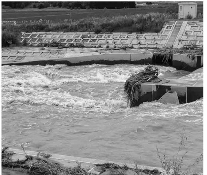
東旭川地域では河川が氾濫。(写真は倉沼川7/4)

先般の豪雨により、被害にあわれましたすべての皆様に心からお見舞い申し上げます。西日本では200人を超える死者、不明者など、甚大な被害が発生しています。また、旭川市をはじめ道北各地でも洪水被害、市街地での浸水、冠水などが発生し、生業や日常生活に大きな影響が出ています。 道北地域で災害にあわれた方におかれましては医療・介護についてはもちろん、何かお困りのことがございましたら遠慮なくご相談下さい。また、道北勤労協会の病院、診療所では災害義捐金を受け付けております。ご協力をお願いいたします。