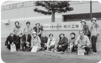
豊岡西友の会バスツアー