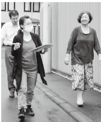
昨年の訪問行動の様子