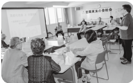
豊岡東友の会総会