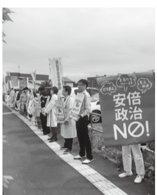
安倍9条改憲NO訴える

7月9日には、一条通沿いで「憲法9条を守る」街頭宣伝行動が行われました。 30人の職員が道路に面してプラカード、横断幕、のぼりなどをもってズラリと並んだ光景はアピール度