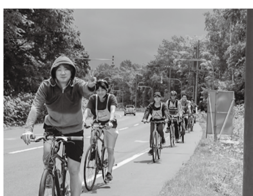
平和を願い疾走する職員

6月23日(土)24日、今年で17回目となる道北反核・平和自転車リレーが開催されました。 26人の職員が層雲峡から一条通病院までの約70kmを、ペダルに平和への願いを込めて走りぬきました。