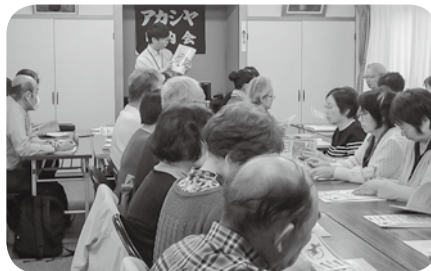
千代田友の会総会