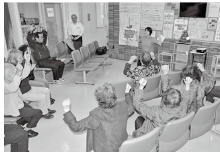
健康体操で身体を動かす

い、交流を深める場となっています。参加者の多くは友の会の旅行などの行事に参加して誘われたり、案内チラシを見てというよう旭川北病院周辺地域の友の会の方です。その中で今回参加していた独居高齢者の方々は、「独居はつまらない。こういう会に参加して勉強や交流することで気持ちが幅がでてくるの」、「色んな知識を勉強出来ていい」と思い参加している。「行事で顔は知っていたけれど