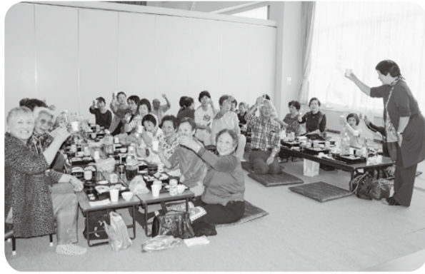
温泉&パークゴルフ旅行「みんなでカンパニー」(9/19)