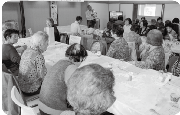
温泉交流会に48人が参加(9/27)