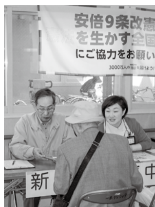
一条クリニックでの署名呼びかけ