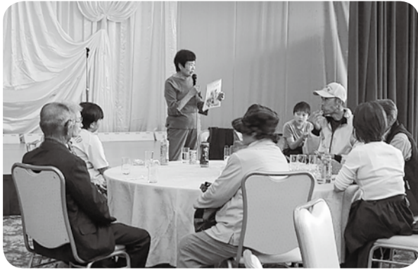
羽幌バス旅行で「いつでも元気」購読呼びかけ(9/24)