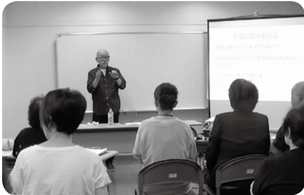
「新しい手話の普及にあたって」講演会開催(9/30)