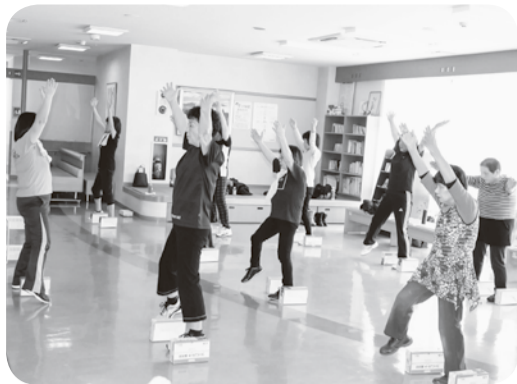
看護師の指導で運動する参加者