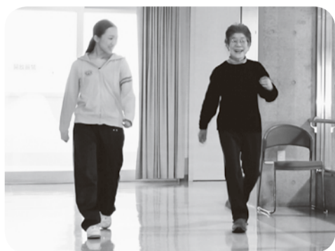
笑顔で職員と一緒にウォーキング

旭川医院では毎 月2回、友の会員 さんの健康教室を 開催しています。 1月は旭川障が い者福祉センター おびつたで「健康 ウォーキング」を 行い、10人が参加 しました。 20分歩いて10分 休憩、また20分歩 くというメニューを参加 者同士や職員と会話しな がら、楽しくウォーキン グしました。 参加者は80歳代中心で したが、皆さん生き生き として若々しく見え ます。最年長90歳の方は 「皆さんとの交流を楽し