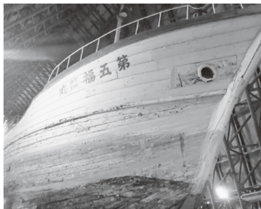
被爆後62年経った第五福竜丸

1954年3月1日午前6時45分、第五福竜丸はビキニ水爆実験に巻き込まれました。この水爆は広島原爆の1000倍の威力に相当し、「死の灰」はマーシャル諸島や同海域で操業していた日本漁船等に降り注いだだけでなく、気流や海流に