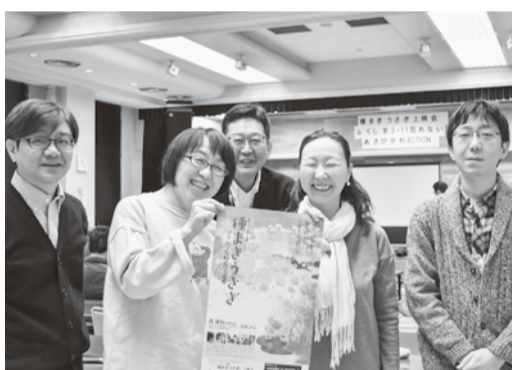
上映会に参加した職員

残るかどうかの選択を迫られている。東電や国に責任があるのに、住民にしわ寄せがいつている。人間の手に負えない原発はなくし、原発政策の裏に何があるのかを正しく知る努力が必要と感じました」と感想を語りました。