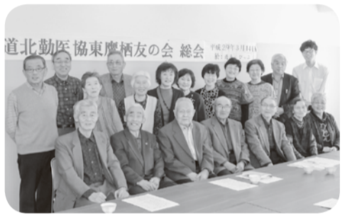
道北勤医協東鷹栖友の会 総会

した。福島での震災合同法要に参加した会員からその様子も話されました。昼食後、福笑いゲーム、ビンゴで盛り上がり、笑顔で懇親を深めました。