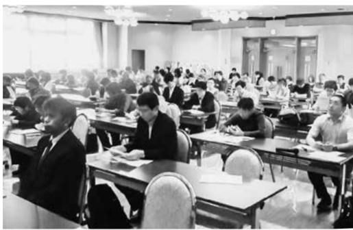
100人の市民が参加し真剣に聞き入る

に喜んで頂くとうと、一生懸命に歌の練習をしていましたが、残念ながら中止に。あいにく雨の天気でしたが、250人の地域の皆さんや患者さん、友の会の皆さんに来ていただき楽しんで頂きました。(西川稔生)