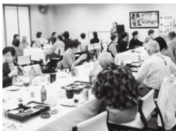
美味しい昼食後は「禁煙」の話