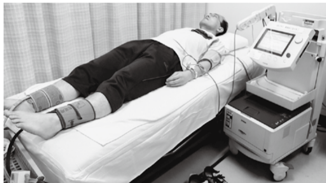
手と足の血圧と脈波を測る「ABI/PWV 検査」

に入り込み、その部分が膨らんだ状態になります（プラーク＝粥腫…じゅくしゅといえます）。これを写真に撮る検査です。