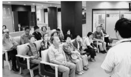
新病院の施設について話を聞く見学者の皆さん