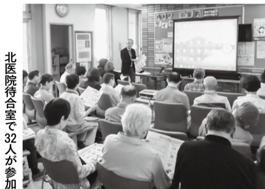
北病院待合室で32人が参加

ました。「認知症のことを勉強して、安心して暮らせる街づくりにも少しも関われる気になりました」などの感想がありました。