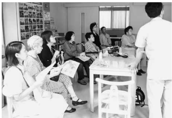
真剣に話を聞く皆さん(一条クリニック中待合室)

毎週木曜日14時から、一条クリニック中待合でお話しをしています。講師陣の顔ぶれも、医師・看護師・栄養士・検査技師・リハビリ技師・薬剤師・事務と多彩です。「糖尿病」という病気に関して、合併症、食事療法、運動療法など色々な角度から、様々な職種の職員が説明をしています。