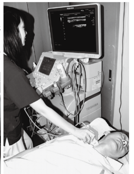
血管の写真を撮る「エコー検査」の様子

動脈硬化があると血管の壁にコレステロールがベタベタとくっつき、それを白血球の仲間（マクロファージ）が取り除こうとして血管の壁の中