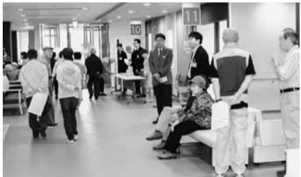
各部門前に対応する職員

9月12日、開院前にご案内しました内覧会には、患者さんや地域の皆さん、医療・介護・福祉関係者など、300人以上の方々にご覧頂きました。今後とも立派な建物に負けないよう、充実した医療活動を進めてまいりますのでどうぞ宜しくお願い致します。