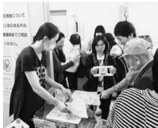
「健康チェック」会場では順番待ちに