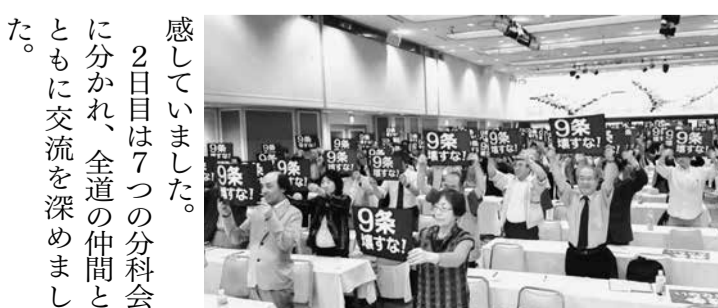
全体会場には全道から274人が参加。「9条壊すな」のボードを掲げてアピール

感じていました。2日目は7つの分科会に分かれ、全道の仲間とともに交流を深めました。