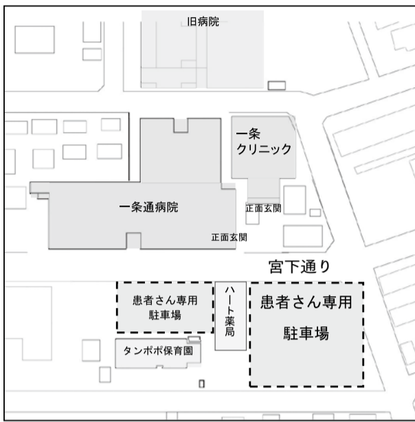
新しい駐車場配置図

この間の工事で患者さんや地域の皆さんには、大変ご迷惑をお掛けしました。点在していた駐車場は、新一条通病院と一条クリニック玄関の向かい(宮下通を挟んで)120台の駐車スペース